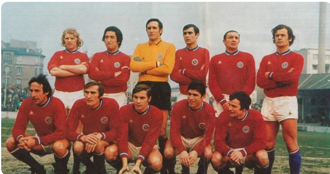
Time PSG em 1970

A história do PSG começa em 1970, na França. A equipe surgiu através de uma junção do Paris Football-Club com a equipe Stade Sangermano no dia 27 de maio daquele mesmo ano, segundo informações do site oficial do time. A combinação se consolidou através da Federação Francesa de Futebol.