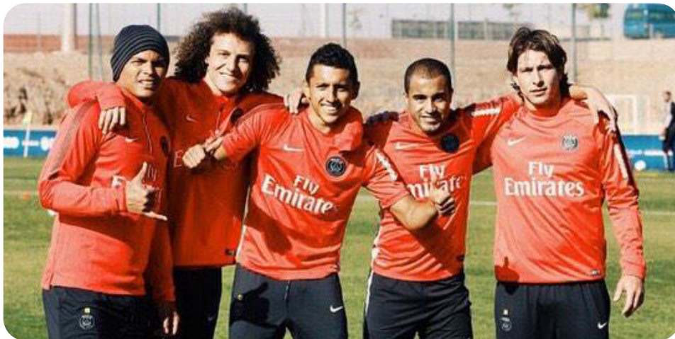
Thiago Silva, David Luiz, Marquinhos, Lucas e Maxwell (2014)

Nos anos 2000, Ronaldinho Gaúcho chegou ao clube e se tornou um grande ídolo da torcida parisiense, lembrado ainda com carinho. Lá, foram 77 partidas e 25 gols. Também integram a lista Nenê, Maxwell, Thiago Motta, Ceará, Lucas Moura, Thiago Silva, Daniel Alves, David Luiz e Marquinhos.